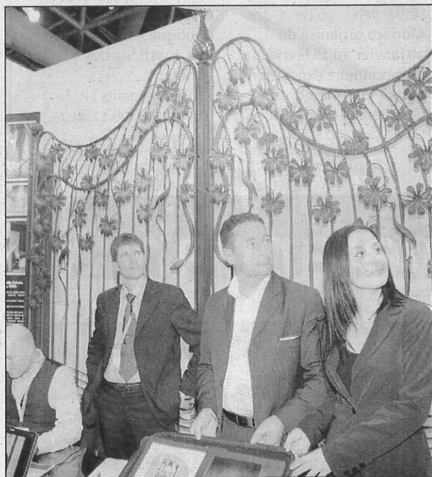
Des ferronneries de grand luxe en provenance d'Italie sont également présentées.